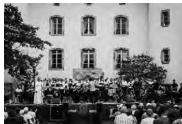
Palacio Etxe Auzia - Saint Etienne de Baigorri