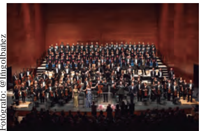
Quincena Musical - 9ª Sinfonía de Beethoven