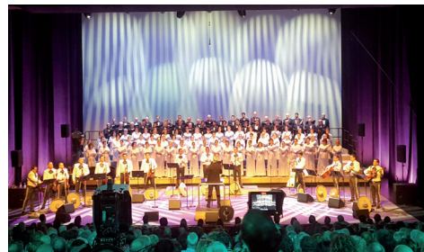
▲ La fusión de la música popular mexicana del Mariachi Vargas con las voces del Orfeón entusiasmó al público que el 5 de noviembre abarrotó el Kursaal.

izan ziren: urriaren 3an, Gasteizen; 4an, Iruñan; 5ean, Bilbon; eta 7an eta 8an, Donostian.