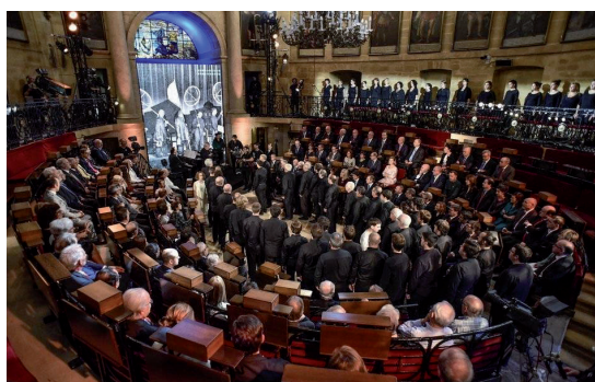
Urriaren 7an, orfeoilariak Gernikara joan ziren lehen Eusko Jaurlaritzaren sorreraren 80. urteurrena ospatzeko ekitaldian parte hartzeko.