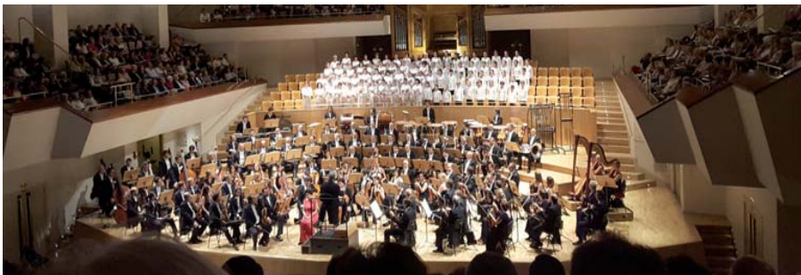
Las voces blancas, en la inauguración del ciclo Ibermúsica, con la Tercera de Mahler, junto a la Orquesta del Maggio Musicale Fiorentino y Zubin Metha al frente, en el Auditorio Nacional, el 16 de septiembre.