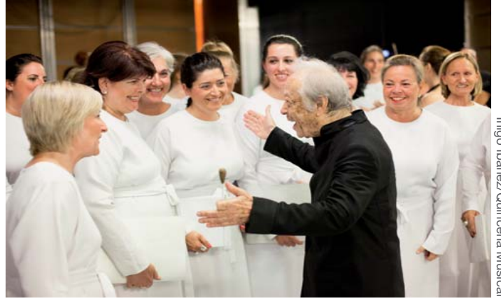
Cercano y vitalista se mostró el director Zedda después del primer contacto "rossiniano" con los orfeonistas.