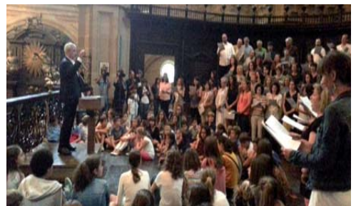
Abuztuaren 14an Reficeren Salbe tradizionala interpretatzen du urtero 1934az geroztik Santa Maria basilikan, bai eta hurrengo eguneko meza eta irailaren 5ean Ama Birjinari eskainitako Bederatzigarrena ere.