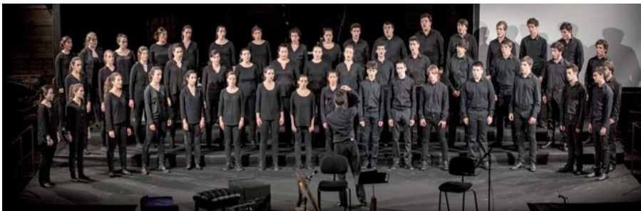
Orfeoi Gazteak ere Hamabostaldi Ibiltarian parte hartu zuten: abuztuaren 24an kontzertu bat eman zuten Arantzazuko santutegian (Oñati) eta Jordi Savall eta bere taldearekin eszenatokia partekatu zuten.