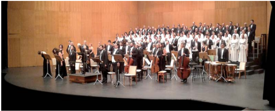
La misma magia Zedda-Rossini se repitió en el Palacio de Festivales de Santander.