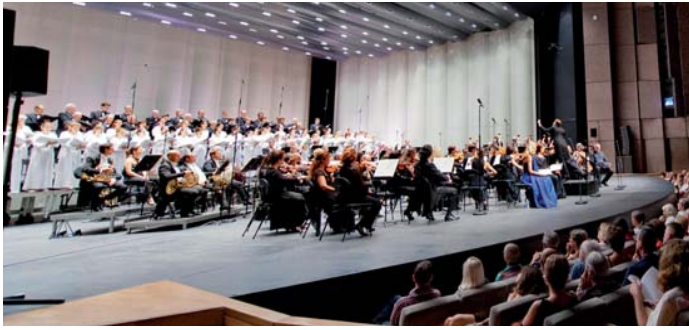
En Perpignan y Montpellier, dentro de la 30 edición del Festival Radio France-Montpellier que fue clausurada por el Orfeón.