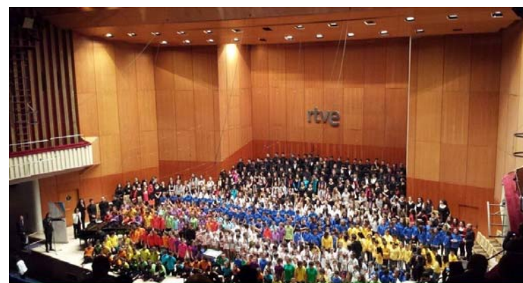
El Orfeoi Gazte en el concierto de clausura del I Festival Internacional de Coros de Niños y Jóvenes celebrado en el Teatro monumental de Madrid, el 8 de marzo, con los integrantes de otras 16 agrupaciones corales. El día 7, el coro joven del Orfeón interpretó otro concierto en solitario en la Basílica de la Concepción.