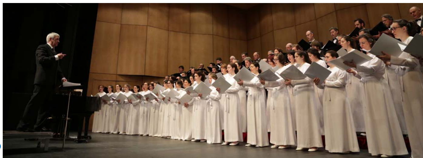
En el teatro Auditorio Ciudad de Alcobendas, el 19 de marzo, el plato fuerte de la temporada de conciertos de la Fundación Ciudad de Alcobendas.