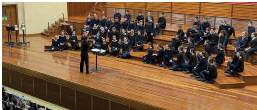
Orquesta Sinfónica de Euskadi

Es el tema que un grupo seleccionado del Orfeoi Txiki grabó el 21 de marzo para la campaña nacional emprendida por el movimiento social “El futuro es la memoria” destinada al programa de formación de cuidadores de personas con Alzheimer.