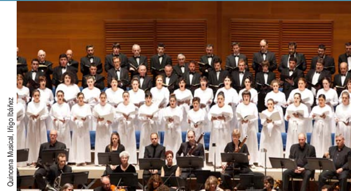
Requiem de Fauré con la Orquesta de Cámara de Escocia y Robin Ticciati al frente.

Noticias del Orfeón Donostiarra / Donostiako Orfeoiaren berriak