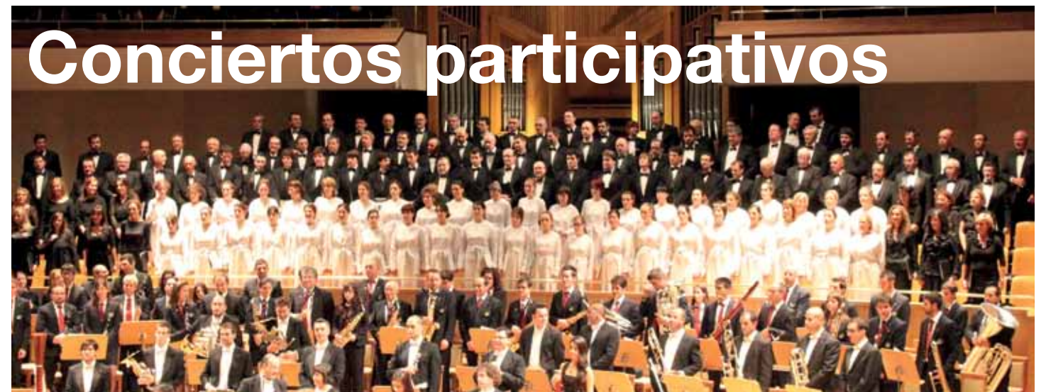
Tuto Verdi, con 400 voces en el Auditorio Nacional