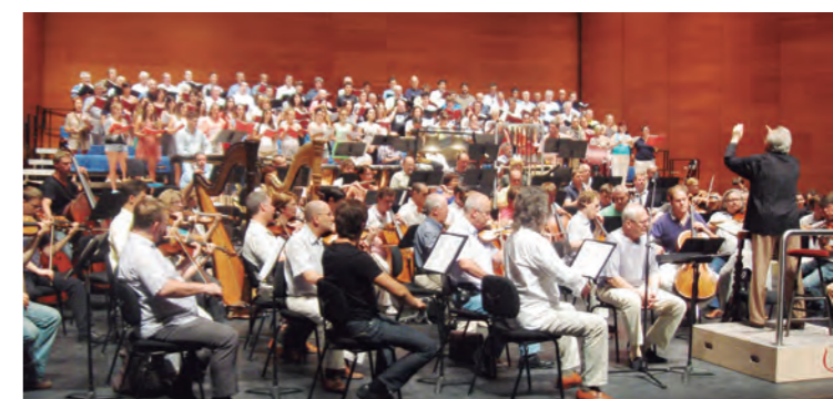
▲ El coro, los solistas y la Filarmónica de San Petersburgo, con Yuri Temirkánov, durante el ensayo de Iván el Terrible en el Kursaal.