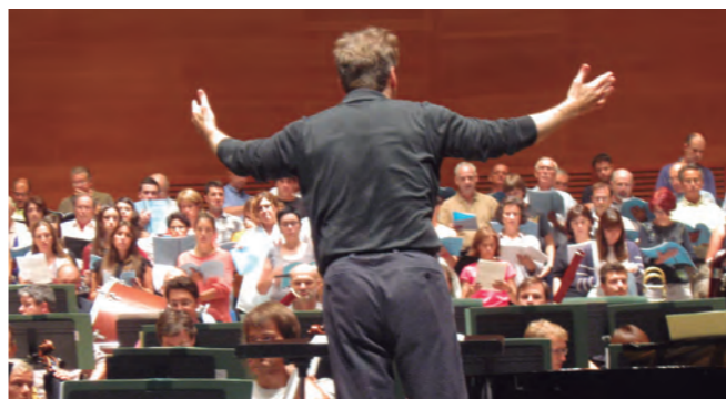
▲ Ensayo con Jonathan Nott y la Orquesta de Bamberg para el concierto de clausura de la 73 edición de la Quincena en el que se interpretó la Sinfonía de los Salmos de Stravinsky.