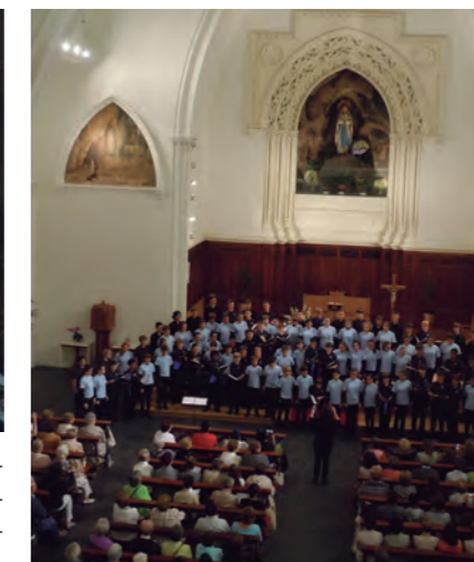
◀ El Orfeoi Tixki recibió la visita del coro infantil Pacific Boychoir Academy de California y ambos coros ofrecieron un concierto el 11 de julio en la iglesia de Capuchinos de Donostia.