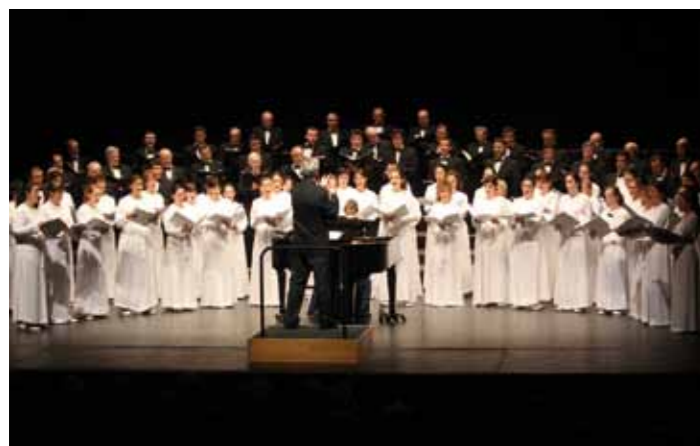
▲ Fragmentos de óperas, zarzuelas y una selección de obras folklóricas internacionales para celebrar los veinte años de vida del Teatro de Baracaldo (Bizkaia), el 5 de noviembre.