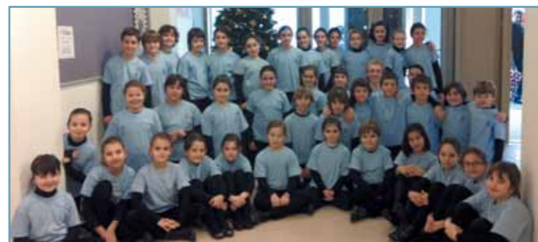
◀ TXIKIEN ARGAZKIA ZUMARRAGAN. Zumarragako Zelai Arizti aretoa bete egin zen abenduaren 18an Orfeoi Txikiak eta Zumarragako Musika Bandak elkarrekin eskaini zituzten euskal gabon-kantak entzuteko. Joan den hiru hilabetean, Orfeoi Txikiak Organo Erromantikoko Nazioarteko Zikloan parte hartu zuen bi kontzertu eskainiz: urriaren 8an Zumarragako Andre Mariaren elizan eta urriaren 23an Loiolako basilikan.