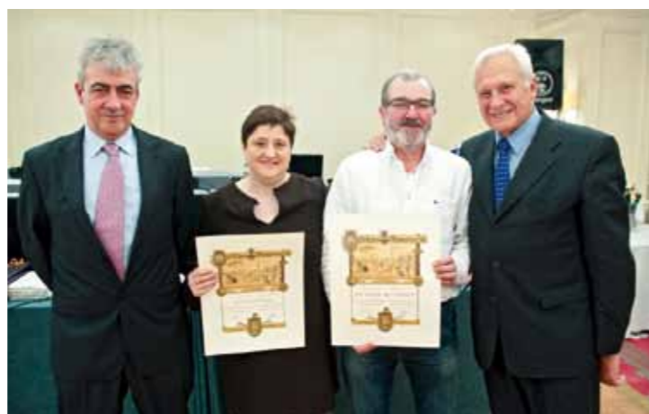
Argazkia: Juanxo Egaña