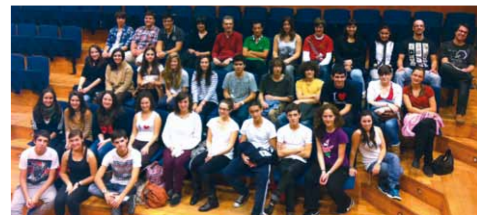
▲ Los componentes del Coro Joven de la Orquesta Sinfónica de Galicia visitaron la sede del Orfeón y compartieron concierto con el Gazte en la iglesia de Capuchinos de Donostia el 11 de noviembre.