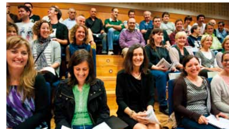
La ministra de Cultura, Ángeles González-Sinde, tuvo ocasión de escuchar al Orfeoi Gazte y de asistir a un ensayo del Orfeón durante su visita a la sede del coro, el 6 de junio.