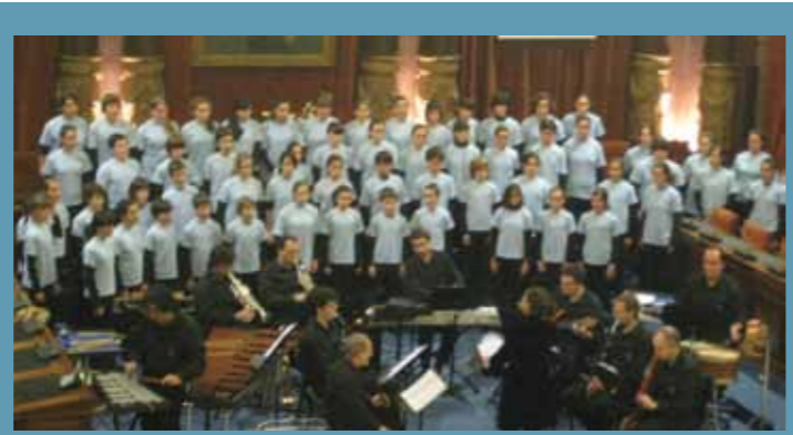
Donostiako udaletxeko osoko bilkuren aretoa txiki gelditu zen Udal Txistulari Bandak eta Orfeoi Txikiak martxoaren 26an emandako kontzertua entzun nahi izan zuen jende guztia sartzeko.

Les invitamos como primer paso a que vean nuestro video institucional, y a que se sumen a nuestros seguidores en Facebook mientras navegan por la web y se van familiarizando con ella.