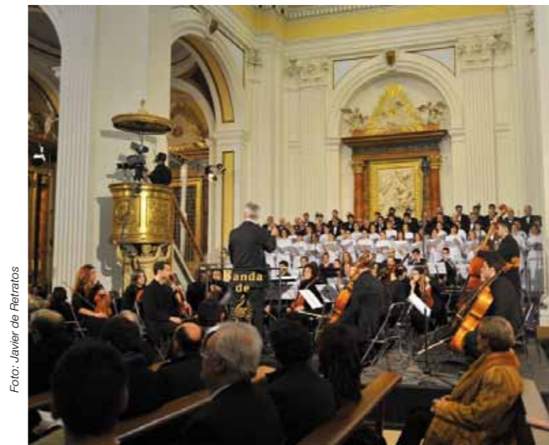
Misa de Difuntos en la restaurada iglesia de Santa María la Mayor de Épila.

ADISKIDEAK / AMIGOS ADEGI • BANCO BILBAO VIZCAYA ARGENTARIA • BANKOA, S.A. • BULTZ, S.A. • CÁMARA DE GIPUZCOA - GIPUZKOAKO BAZKUNDEA • CASINO KURSAAL • CENTRO KURSAAL • KURSAAL ELKARGINEA, S.A. • CORPORACIÓN PATRICIO ECHEVERRÍA • ELKARGI, S.G.R. • ESCUELA SUPERIOR DE INGENIEROS DE LA UNIVERSIDAD DE NAVARRA (TECNUN) • ETXE ONENAK, S.A. • EUSKALTEL • FÁBRICA NACIONAL DE MONEDA Y TIMBRE • FERROATLÁNTICA, S.L. • IDOM, S.A. • IMCOINSA 1985, S.A. • INDIAR ELECTRIC, S.L. • INDUSTRIAS SEIRAK • LA CAIXA • MICHELIN • MONDRAGON LINGUA • MUNKSJÓ PAPER, S.A. • NUTREXPA • ONCE • REAL SOCIEDAD DE FÚTBOL, S.A.D • URKOTRONIK