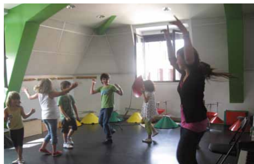
▲ Hasta el 10 de junio se pueden realizar las matriculas para las colonias infantiles musicales organizadas por el Orfeón. Este año tendrán lugar entre el 27 de junio y el 8 de julio para niños y niñas de entre 4 y 8 años de edad y el lema será “El verano suena a... cuentos infantiles”.