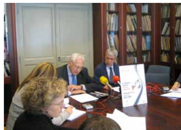
▲ Rueda de prensa para presentar las actividades de 2011: 25 conciertos cerrados hasta la fecha, dos salidas internacionales a Montpellier y Orange, participación en los festivales de Cuenca, la Granja y Quincena Musical, así como en el Ciclo de Ibermúsica en el Auditorio Nacional con la Orquesta de San Francisco.