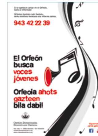
▲ Cartel de la campaña 2011 para incorporar voces jóvenes al coro.