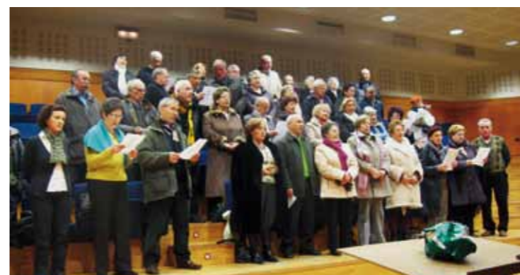
▲ Berangoko abesbatzaren bisita Orfeoia-aren egoitzara, martxoaren 2an.