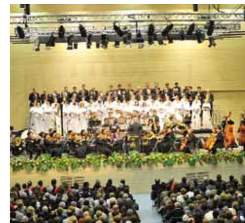
▲ Dos momentos del concierto ofrecido en el espacio polivalente municipal de la localidad aragonesa de Épila, el 15 de enero.