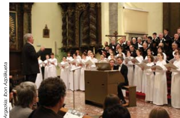
▲ Alegiako Txintxari Abesbatza koruaren 50. urteurrena zela eta, Orfeoa ekainaren 12an Gipuzkoako udalerrri horretako parrokian abestera gonbidatu zuten.