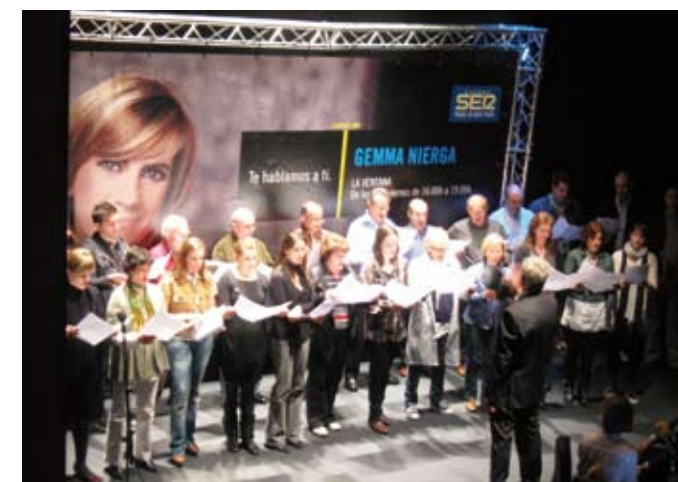
▲ Actuación en directo en el programa radiofónico La Ventana de la Ser, realizado el 23 de abril desde el teatro Principal de Donostia.