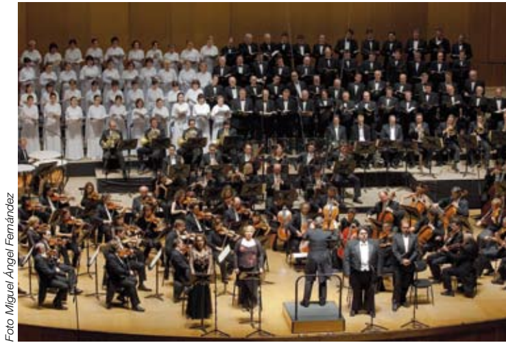
Concierto en el Palacio de la Ópera de A Coruña.

Noticias del Orfeón Donostiarra / Donostiako Orfeoia berriak