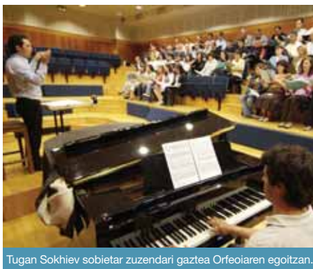
Tugan Sokhiev sobietar zuzendari gaztea Orfeoiaeren egoitzan.

El periódico galo "Voix du Midi" destacó la "síntesis ideal de tensión y rigor" conseguido en este concierto por la dirección de Tugan Sokhiev y agregó que fue "espléndido el fervor vocal de los donostiarras".