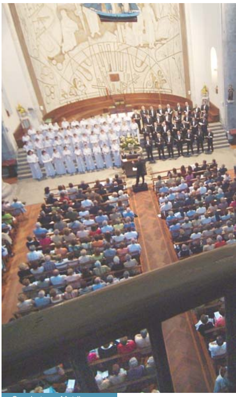
Concierto en Mutriku.