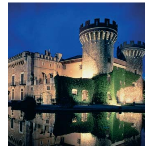
Castillo de Peralada.

Se interpretará la 8ª de Mahler junto a la Sinfónica de Galicia, bajo la dirección de Víctor Pablo Pérez.