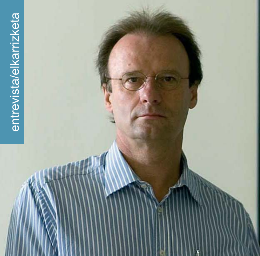
El maestro en la sede del Orfeón