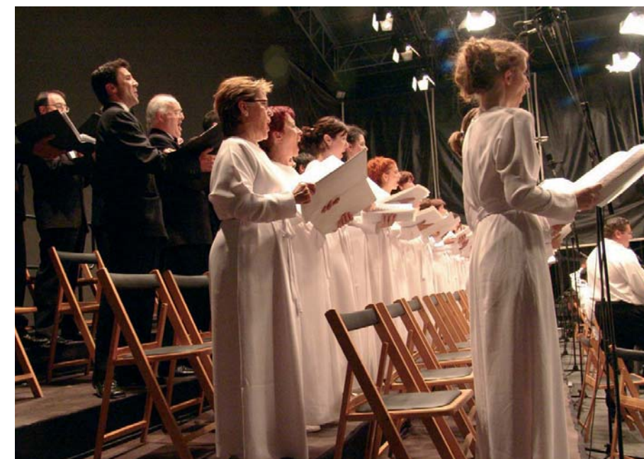
Concierto en Salamanca.

A mediados de julio, Alcalá de Henares celebró el cuarto centenario del Quijote y en Salamanca el 250 aniversario de su Plaza Mayor y ambas ciudades quisieron conmemorar estos hechos histórico-culturales con un programa de óperas interpretado por el Orfeón y la Sinfónica de la región de Murcia bajo la dirección de Sáinz Alfaro. El día 16, el Parque O'Donnell de Alcalá se transformó en auditorio al aire libre para que sus vecinos pudieran escuchar los fragmentos de ópera de Verdi, Mascagni y Borodin programados. El concierto de Salamanca se celebró al día siguiente en el Centro de Artes Escénicas y de la Música con el mismo repertorio.