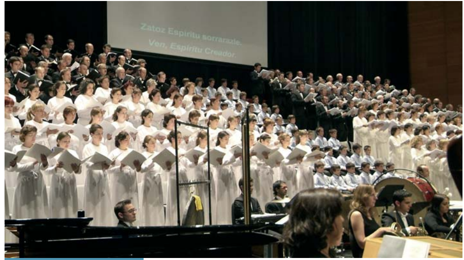
La Sinfonía de los Mil.