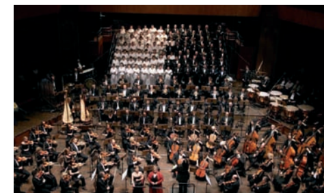
El concierto de Toulouse.

El Orfeón realizó su primera salida internacional de 2005 a la localidad francesa de Toulouse el pasado 24 de marzo. La espléndida sala "Halle aux grains", antiguo mercado de cereales de esta ciudad gala, se llenó en la práctica totalidad de su aforo para escuchar la Sinfonía n° 2 "Resurrección" de Gustav Mahler interpretada por la Orquesta Nacional del Capitolio de Toulouse y el coro, bajo la dirección del norteamericano Joseph Swensen. Era la primera vez que el maestro norteamericano, a quien se entrevista en este número del Andante, se ponía al frente del Orfeón. El público francés acogió una vez más de forma calurosa al coro donostiarra. Algunos, sin duda, recordaban aquella otra versión de la misma obra interpretada en este escenario en